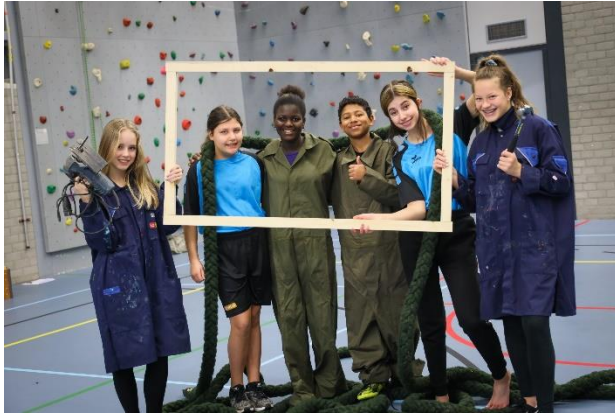
Safety & Security