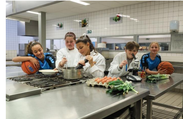
Food & Health