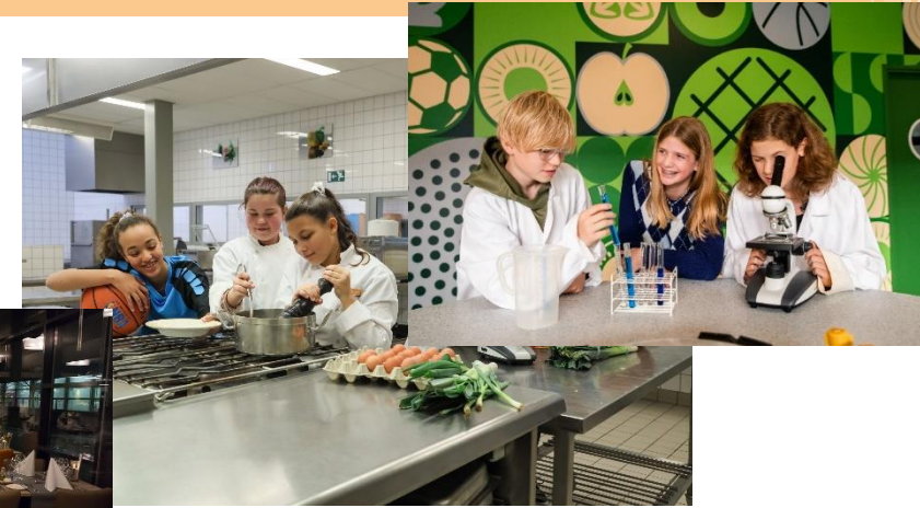
Food & Health