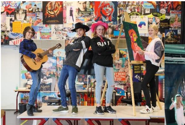
Art & Stage