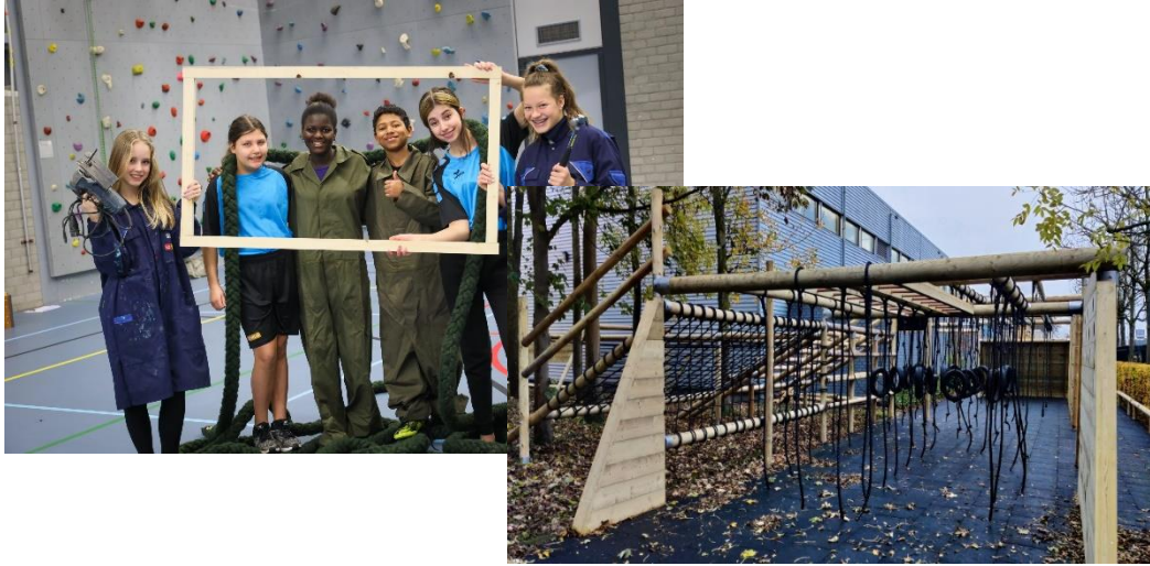
Safety & Security